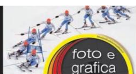
foto e grafica dolomiti

Richiedi le Tue Sequenze Fotografiche e Video SLOW-MOTION su: